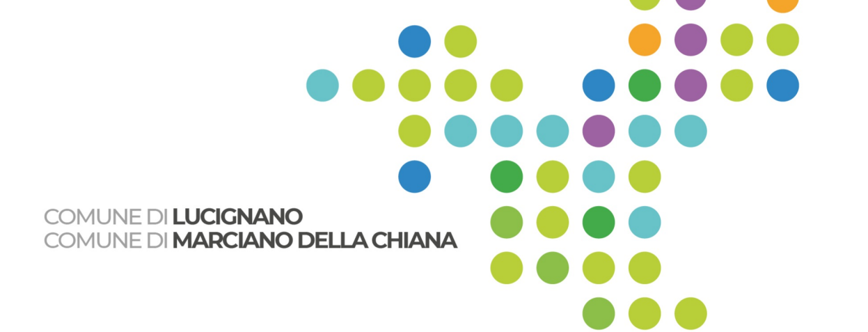
Tavola 02 VAS Est