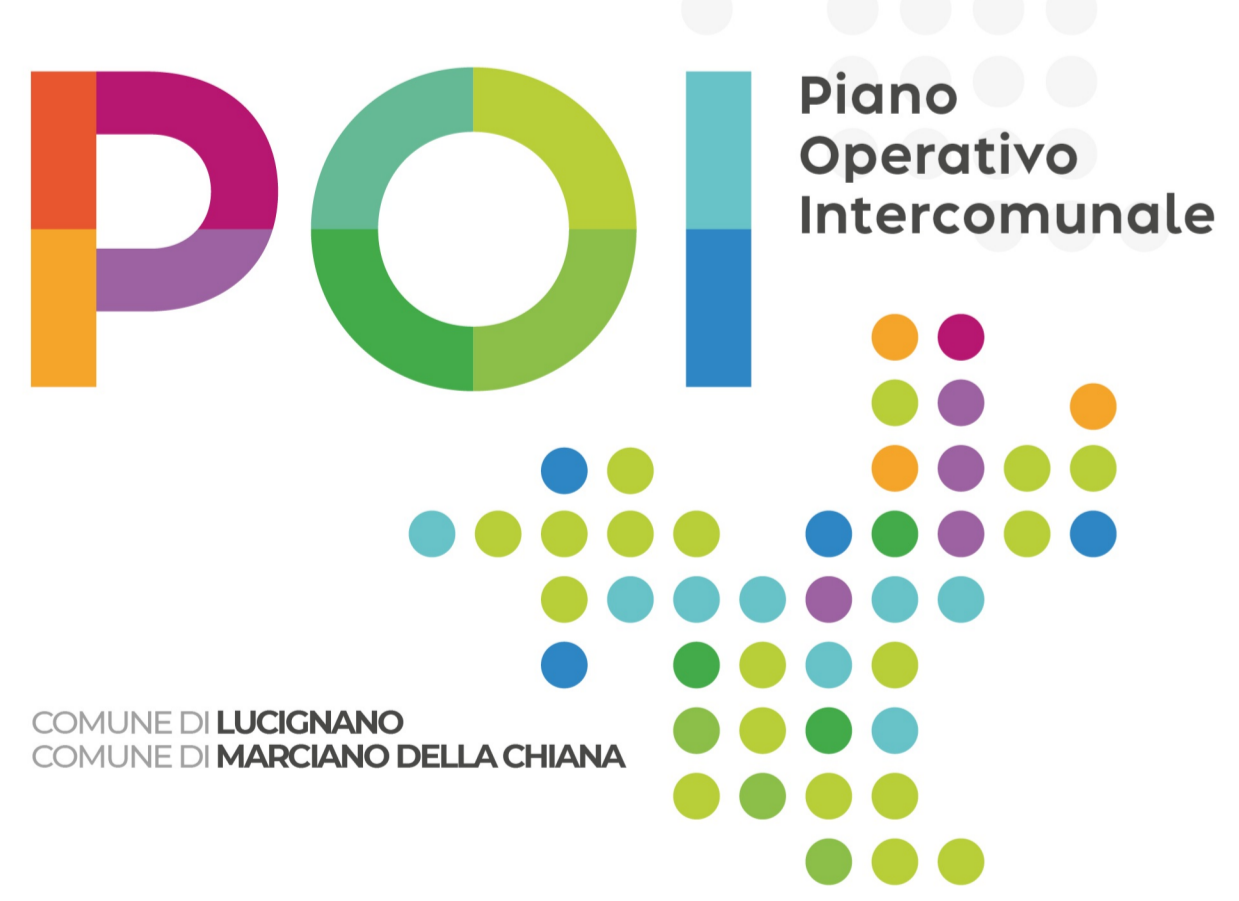
Tavola 02 VAS Ovest

PIÙ COMUNE DI LUCIGNANO COMUNE DI MARCIANO DELLA CHIANA